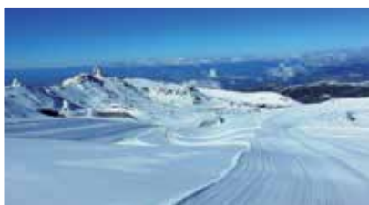
Ski à la Sierra Nevada