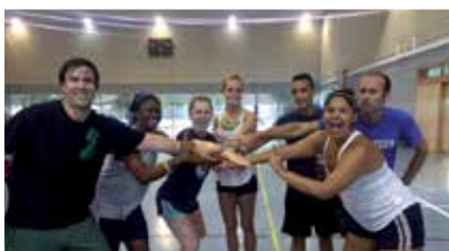
Matches de football et basketball