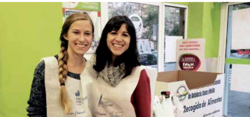
Missions de bénévolat