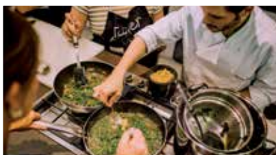
Cours de cuisine espagnole