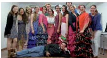
Classes de danse