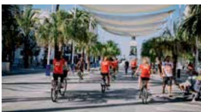
Visites à vélo