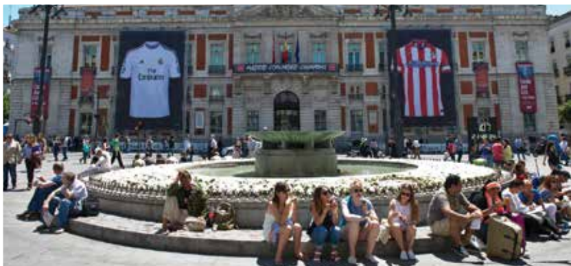
Villes espagnoles: Grenade, Cordoue, Madrid, Barcelone, etc.