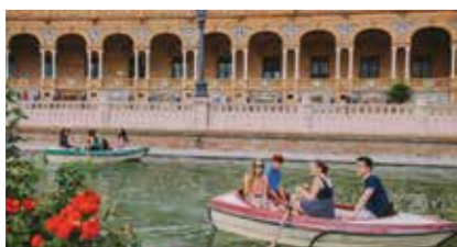
Excursions en barques