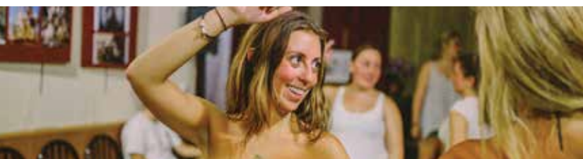
Cours de sevillanas et flamenco