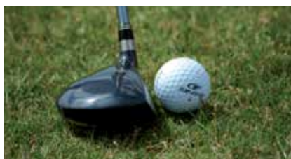
Golf et tennis