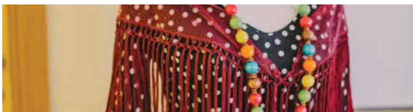
Visites à boutiques de produits régionaux