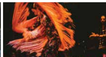
Spectacles de flamenco