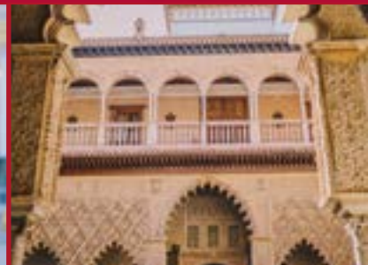
Programa de Arte, Literatura e Historia