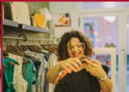
Programa de Español y Compras