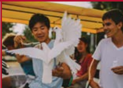
Programa de Visitas Culturales