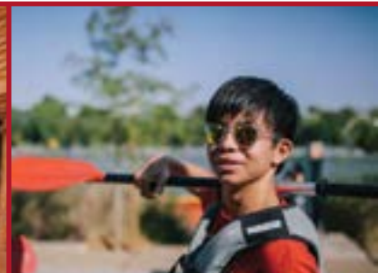
Programa de Español y Deporte