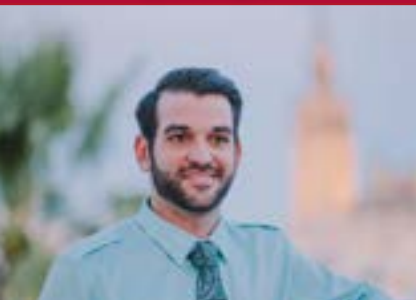
Programa de Español y Negocios