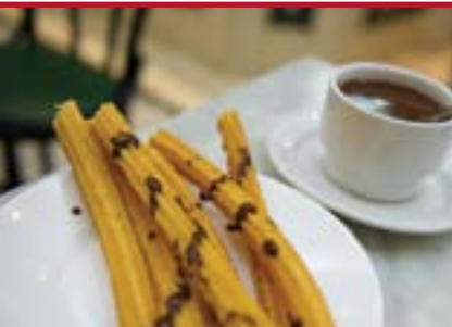
Programa de Gastronomía y Enología