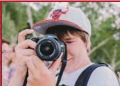
Programa de Español y Fotografía