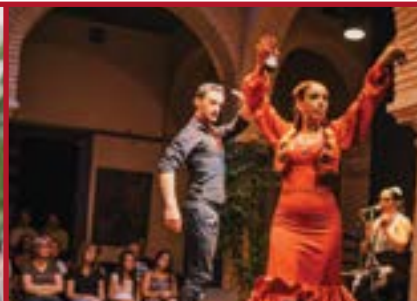
Programa de Flamenco